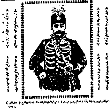
عبدالله میرزا قاجار (پسر ناصر شاه قاجار) در زمان سلطنت ناصر شاه قاجار

تذکره تاریخ ایران از زمان ساسانیان تا زمان سلاجقین و مغولان و صفویان و قاجاریان و پهلویان را در این کتاب به تفصیل شرح داده اند. این کتاب از نظر نگارش و تدوین و درج مطالب و ترتیب آنها بسیار عالی است. در این کتاب به تفصیل به تاریخ ایران از زمان ساسانیان تا زمان سلاجقین و مغولان و صفویان و قاجاریان و پهلویان پرداخته شده است. این کتاب از نظر نگارش و تدوین و درج مطالب و ترتیب آنها بسیار عالی است.